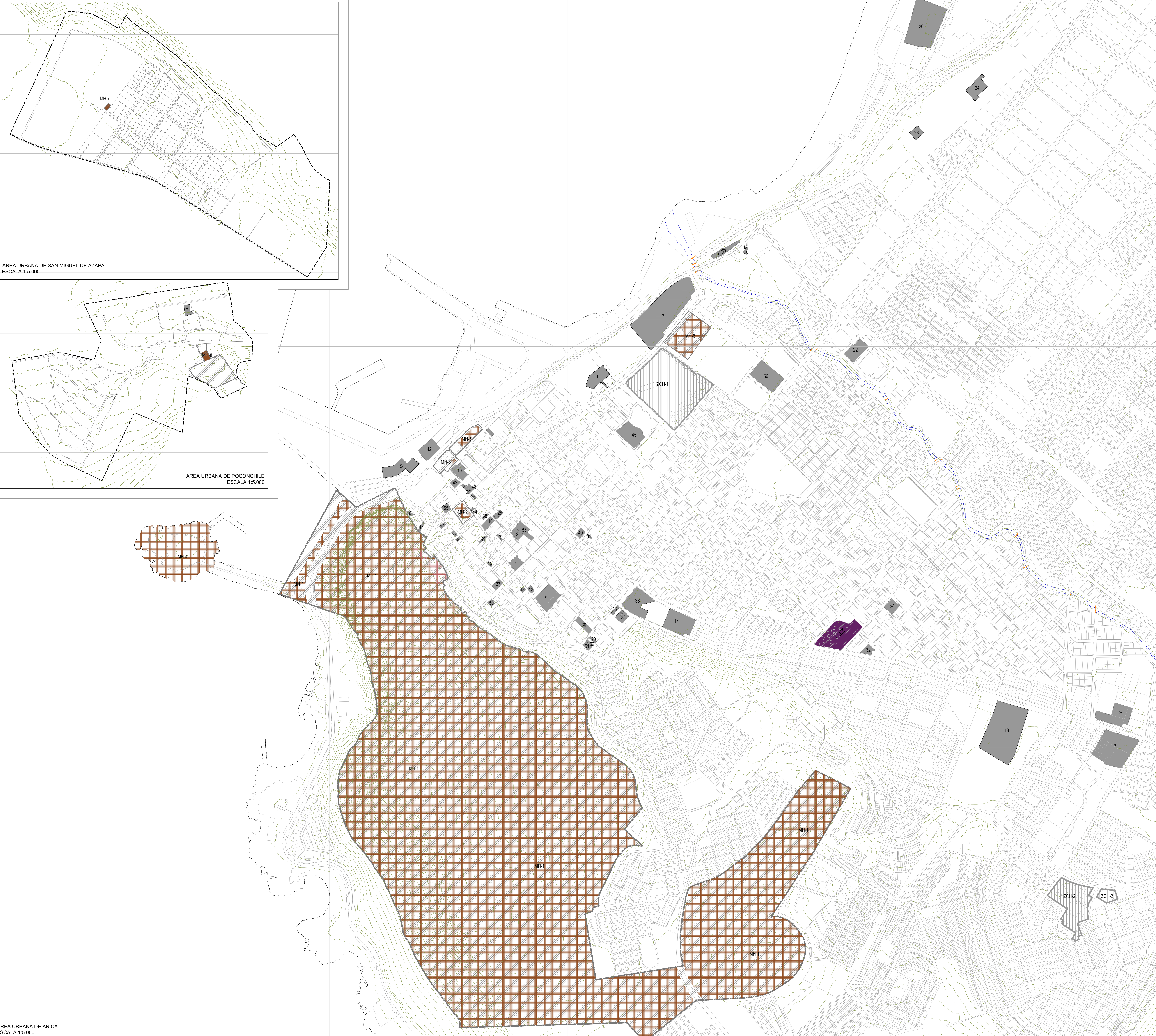
ÁREA URBANA DE ARICA ESCALA 1:5.000