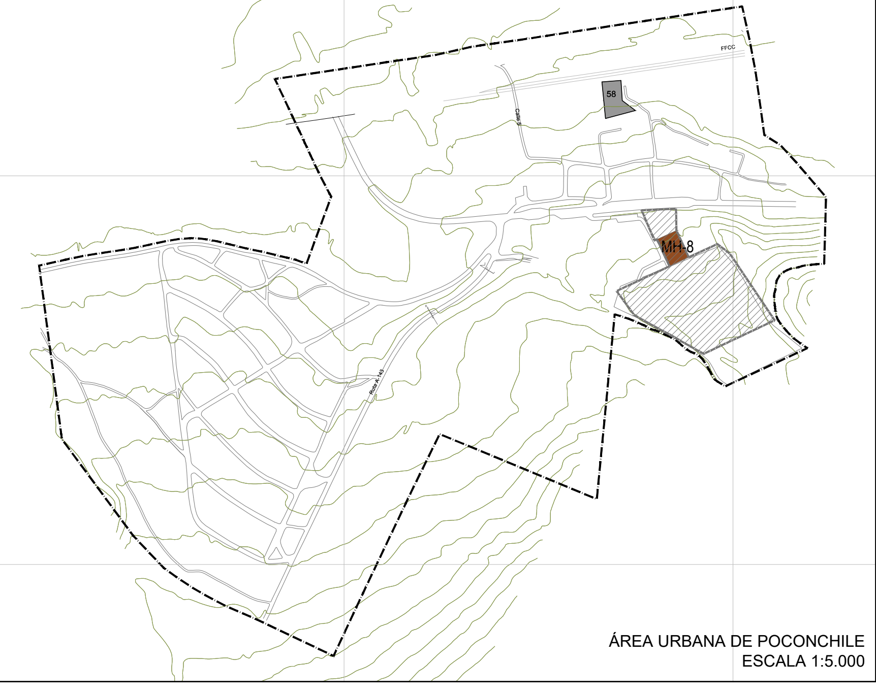
ÁREA URBANA DE POONCHILE ESCALA 1:5.000