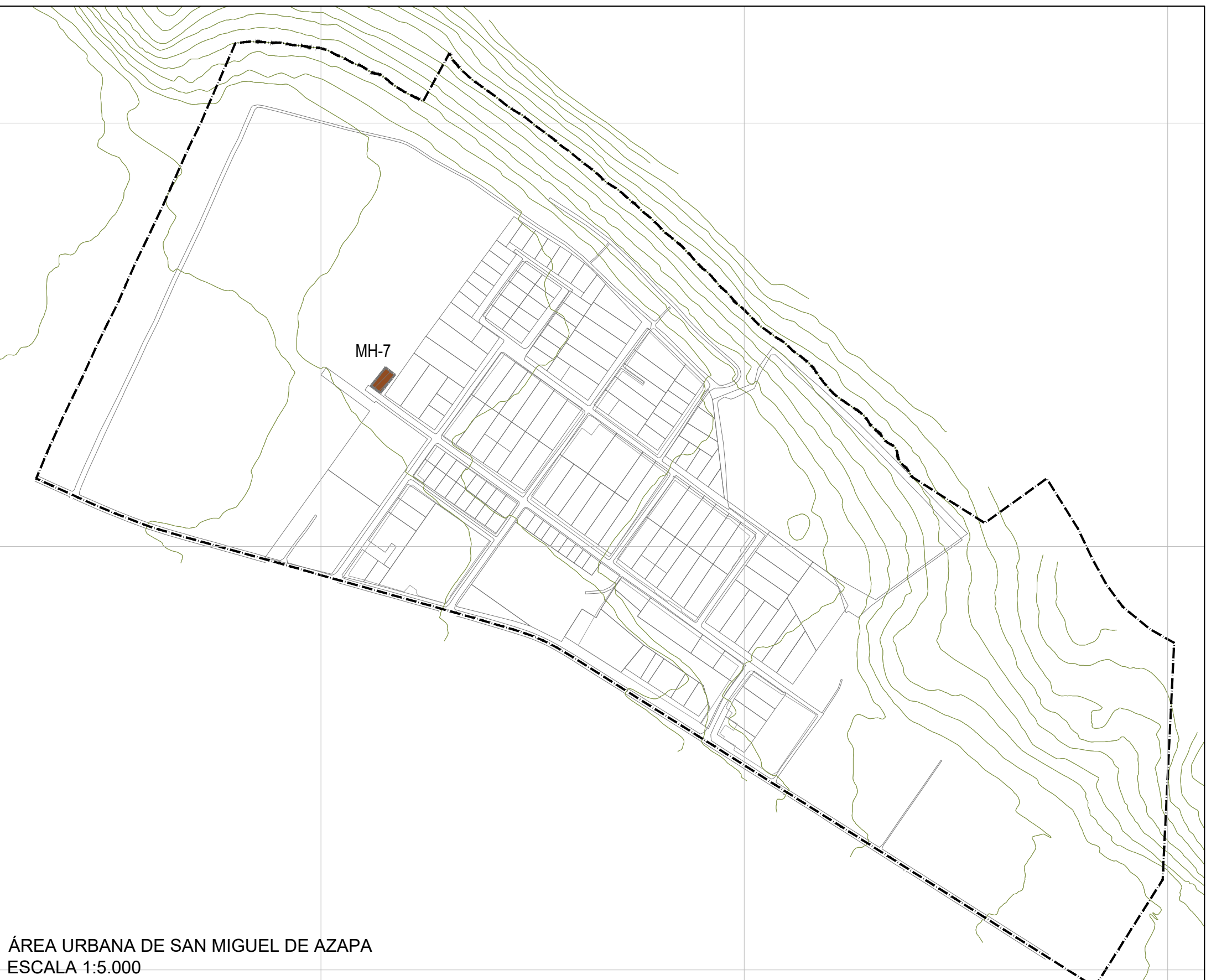
ÁREA URBANA DE SAN MIGUEL DE AZAPA ESCALA 1:5.000

Director/a Sectorial Comunal de Planificación Sector Municipal de Arica